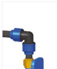
Pumpkoppling med PEH-koppling