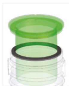
Isolerad teleskopisk plastbetäckning