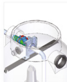
Pumpkoppling med snabbkoppling