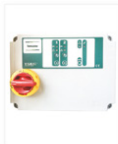
Styrautomatik för inomhusbruk