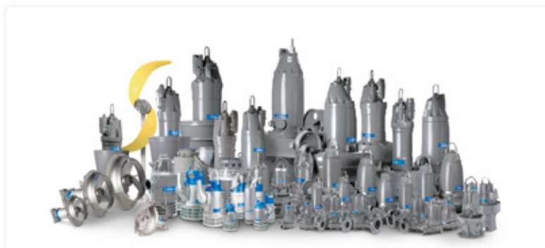
Pumpar från Flygt

”Höljen för de kompakta pumpstationerna från Eccua är tillverkade med rotationsgjutning, vilket ger ett helgjutet, skarv/öst hölje för pumpstationen. Dessa pumpstationer är lätta, självförankrande och enkla att sköta. Eccuas pumpstationer är försedda med legendariska Flygt-pumpar.”