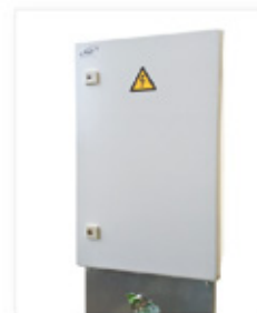
Styrautomatik för utomhusbruk