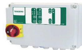
Inomhusskåp vid 3-faspumpar